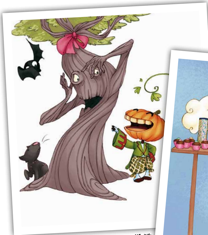
Visuels non définitifs

Le dernier recueil de comptines qu'elle a illustré, "Ma petite boîte à Fabulettes", est sorti en novembre 2010 aux éditions Scarabéa.